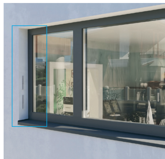
beszerelés rávakolással GEALAN-CAIRE® smart

A GEALAN-CAIRE® smart alkatrészek különféle szín- és felületkivitelben állnak rendelkezésre és tökéletesen illeszkednek az Ön ablakrendszeréhez kívül és belül. A szellőztető rendszert rászigeteléssel és rávakolással szerelhető be. Egy kiegészítő csatorna alaprasz, amely egy adapter segítségével 20 mm-es rácsban kibővíthető, lehetővé teszi a problémamentes beszerelést az Ön hőszigetelő rendszerébe, függetlenül attól, hogy milyen vastag a szigetelőréteg. Csak az ablakmélyedésben lévő keskeny levegőbemeneti és -kimeneti rácsok maradnak láthatók.