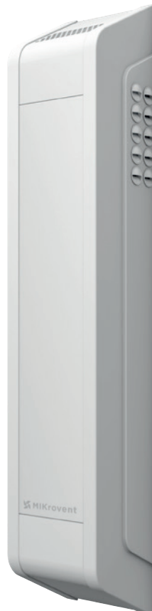
GEALAN-CAIRE® MIKrovent 60 / 120

GEALAN-CAIRE® MIKrovent 120: Átáramló levegőmennyiség 60-120 m 3 óránként. Nagy helyiségekhez (pl. óvodák, iskolák). Az érzékelők a hőmérsékleten és a páratartalomon kívül opcionálisan a CO 2 és a VOC tartalmat is mérik.