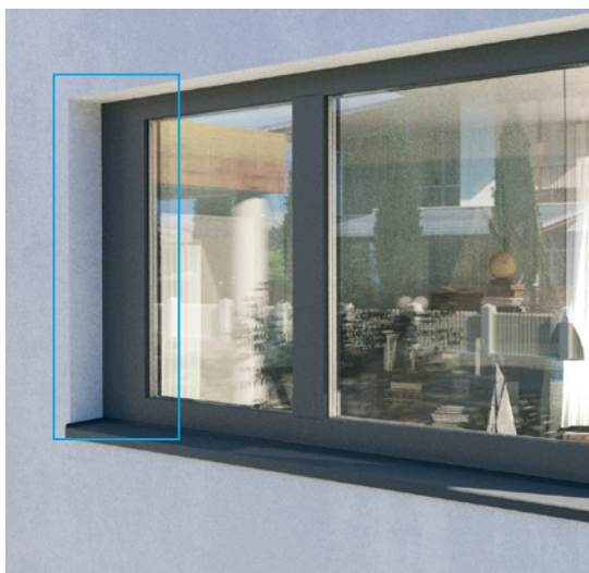
GEALAN-CAIRE® smart láthatóan a keretre szerelve

A GEALAN-CAIRE® smart egy aktív, decentralizált szellőztető rendszer hatékony hővisszanyeréssel meglévő és új épületek számára, amely a szellőztetéssel és az energiahatékonysággal szemben támasztott legmagasabb igényeket is kielégíti. Precíz érzékelőtechnika méri a levegő hőmérsékletét, illetve páratartalmát és teljesen automatikusan vagy individuálisan vezérli a friss levegőellátást. A szűrők felfogják a port, a pollent és más káros részecskéket. A GEALAN-CAIRE® smart rendszert kényelmesen irányíthatja okostelefonjáról vagy táblagépéről mobilalkalmazáson keresztül és egyszerűen integrálhatja smart home rendszerébe. Az alkalmazások Android és iOS operációs rendszerekre egyaránt rendelkezésre állnak.